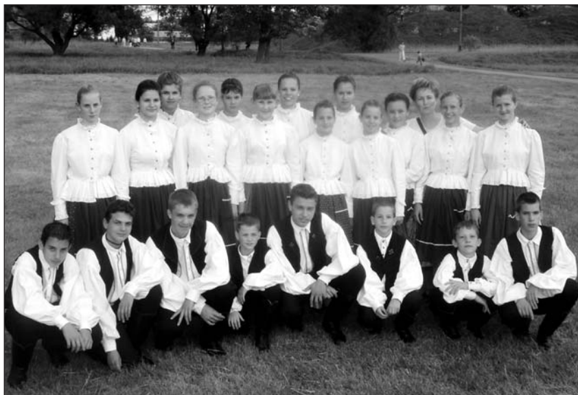
Sikerrel léptek fel néptáncosaink.

A helyi sörgár vendéglőjében minden este magyar ételeket főznek majd. Az egyesület tagjai közül kettő minden alkalommal jelen lesz, hogy a vendégekkel elbeszélgessen. Meghívják parlamenti képviselőket, a záróestre pedig várják Peter Bernasconi polgármestert is.